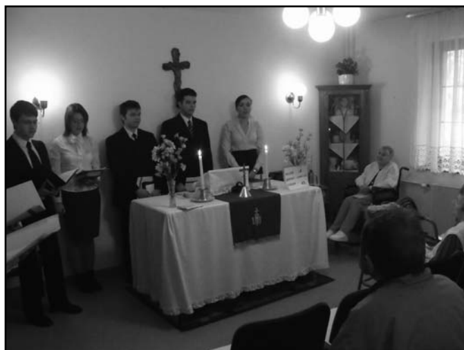
Teológusnap a Pesterzsébet-Klapka téri gyülekezet területén lévő idősök otthonában