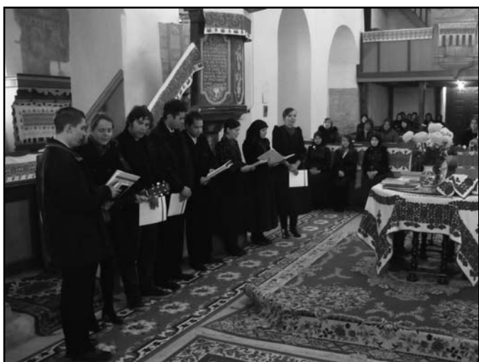
Teológusok szolgálata Széken (Erdély)