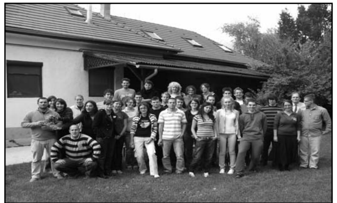
Gólyák dékán úrral

Folytattuk az esti beszélgetéseket Sólámpa címmel, amely a teológus életet a lelkési oldal, az elhívás felől közelíti meg. A félévi első ilyen alkalmon a Viskó c. könyvről beszélgettünk Tóth Sára irodalmár segítségével. Néhány évvel ezelőtt már rendeztünk programsorozatot Párbeszélgetések címmel, melyben a lelkészek családi életéről, a házasság lényegéről gondolkodtunk együtt. Ezt ebben a félévben is fellevenítettük és elsőként a másokra találásról, a pár-